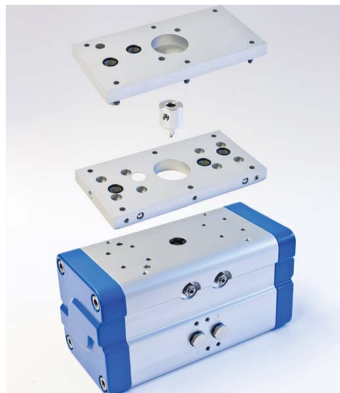
Eine harmonische Einheit ergeben die Produktkomponenten von bar

Alle Rechte vorbehalten. Die Inhalte unterliegen dem Urheberrecht und den Gesetzen zum Schutz geistigen Eigentums sowie den entsprechenden internationalen Abkommen. Sie dürfen ohne die schriftliche Genehmigung des Herausgebers weder für private noch für Handelszwecke kopiert, verändert, ausgedruckt oder in anderen Medien - welcher Art auch immer - verwendet werden.