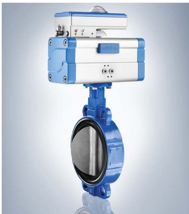
Der Positioner positrol von bar

Basierend darauf hat das Unternehmen im Rahmen dieser Produktreihe ein Steuergerät für Armaturen mit aufblasbarer Dichtung entwickelt und als ein „Highlight“ auf der ACHEMA im vergangenen Juni in Frankfurt, an der bar seit den 80er-Jahren kontinuierlich teilnimmt, präsentiert. Bei den üblichen Anwendungen im Schüttgutbereich helfe die bar-ICS, Verschleiß zu vermindern und frühzeitig Prozessfehler zu bemerken. „Eine weitere Variante ist eine spezielle Steuerung als Anfahr- und Drucksicherungsautomatik für Druckluftnetze“, führt die Marketing-Expertin aus. Das Unternehmen bietet seinen Kunden auch eine Vielfalt an Zubehör an. Hierzu zählen Endschalterboxen, Positioner, Magnetventile, Handnotgetriebe, Druckverstärker, Geschwindigkeitsregler sowie Montagezubehör. Mit positrol präsentiert der Hersteller passend dazu einen Positioner und 3-Positions-Steuergerät mit direkter pneumatischer Schnittstelle zum Schwenkantrieb actubar.