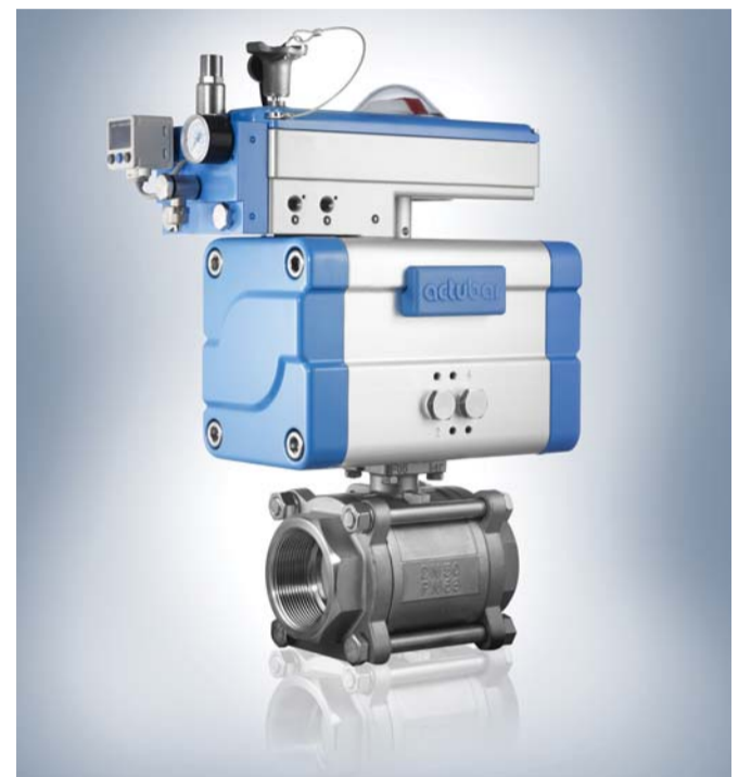
Beim actubar handelt es sich um die neue, intelligente Generation pneumatischer bar-Schwenkantriebe

Bewegende Geschichte Nach der Unternehmensgründung erfolgte im Jahr 1981 die Konzentration auf das Kernprodukt, den Doppelkolben-Schwenkantrieb mit selbstzentrierenden Kolben nach dem Zahnstange-/Ritzel-Prinzip. bar führte damals als erster Anbieter auf dem Weltmarkt „Pneumakugelventile“ ein: Eine kompakte Funktionseinheit, bestehend aus Armatur mit Pneumatik-Antrieb. Der Umzug der bar GmbH, die als Mitglied in den Verbänden VDMA und DVGW den Markt im Blick hat, fand 1990 in ein neues Gebäude mit gro-