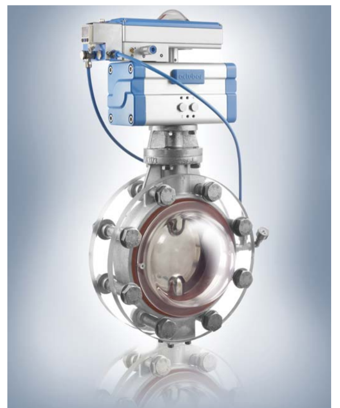
Die bar-ICS mit aufblasbarer Dichtung hilft bei den üblichen Anwendungen im Schüttgutbereich, Verschleiß zu vermindern und frühzeitig Prozessfehler zu bemerken

ßen Produktions- und Büroflächen im Gewerbegebiet Dattenberg statt. Weitere Einführungen folgten bis hin zur Entwicklung von 2- und 3-teiligen Edelstahl-Kugelhähnen, konzipiert für den Direktaufbau von pneumatischen und elektrischen Schwenkantrieben, 1997. „bar-vacotrol“, das ValveControl-System, mit dem Automatik-Armaturen geregelt werden können, wurde 2005 vorgestellt, ebenso wie der „actubar“. „Der actubar ist die neue, intelligente Generation unserer pneumatischen Schwenkantriebe. Äußerlich unverwechselbar und technisch einzigartig bietet der actubar völlig neue Vorteile und Nutzen. Der actubar ist Hauptbestandteil des neuartigen ValveControl-Systems bar-vacotrol, einem modularen, intelligenten System zum Überwachen und Regeln von Automatik-Armaturen,“ führt Klaus Scholl aus. In Verbindung mit den direkt aufbaubaren Systemkomponenten bar-positurn2 oder bar-positrol werden mit actubar auch Absperrarmaturen kostengünstig regelbar, lautet